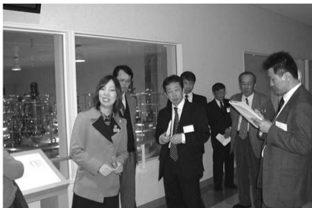
工場見学醸造タンク付近