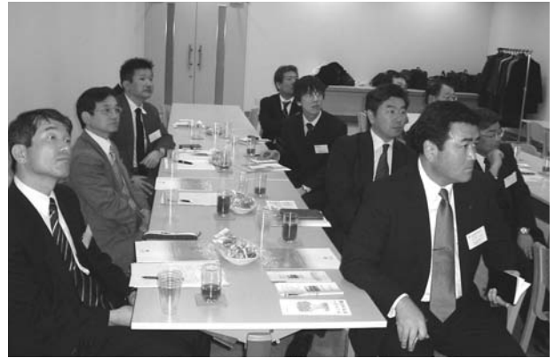
講演に聞き入る参加者