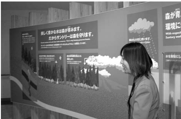
環境保全への取り組み説明