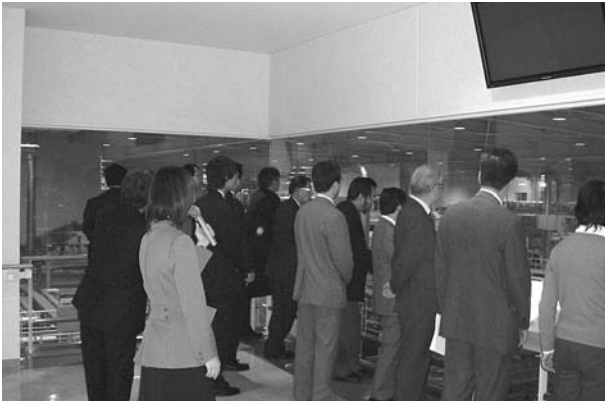
ウーロン茶充填工場付近