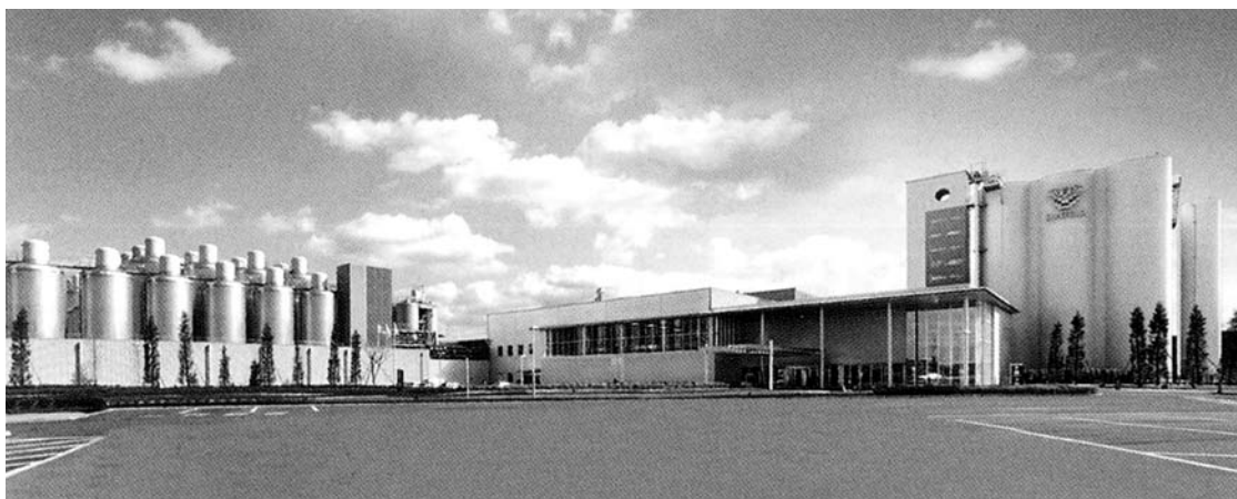
サントリー(株) 九州熊本工場

製剤機械技術研究会第28回工場見学会はサントリー株式会社のご厚意により、九州熊本工場（エコファクトリー）を見学した。